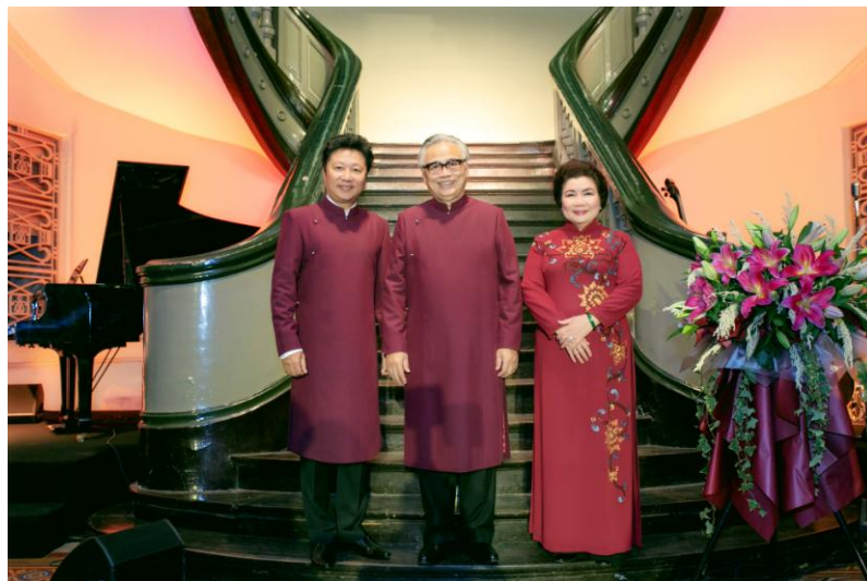
Viện trưởng và hai Phó Viện trưởng của Viện Trang phục Việt