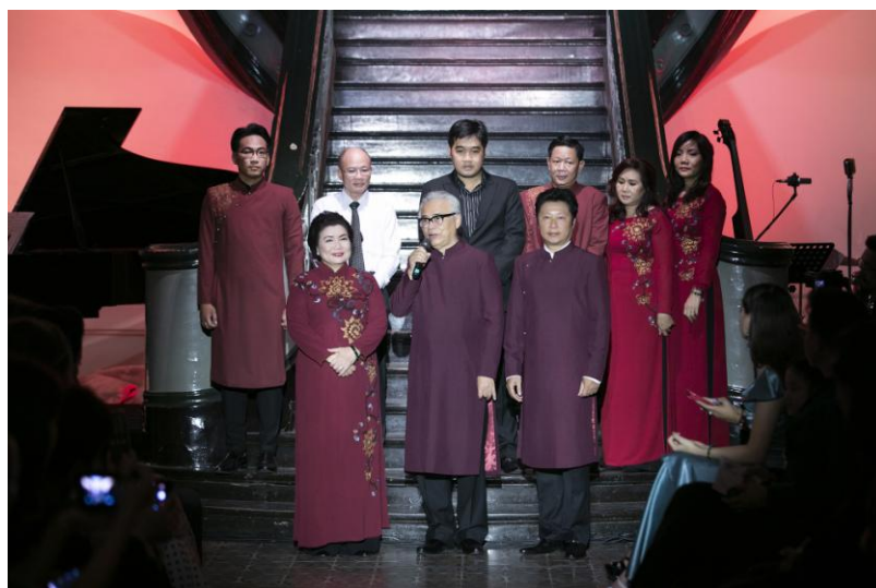
Viện trưởng, hai Phó Viện trưởng và các Trưởng phòng chức năng Viện Trang phục Việt.