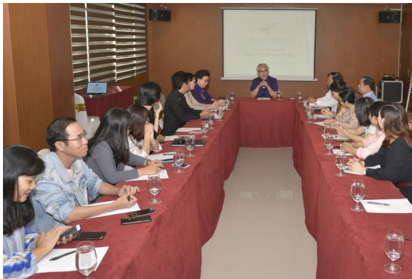
Tiến sĩ Viện trưởng Viện Trang phục Việt giới thiệu chương trình Tọa đàm

Lễ ra mắt gồm hai nội dung khác nhau. Một là tổ chức Tọa đàm lần thứ nhất về Trang phục Xứ Đàng Trong tiến hành tại khách sạn Mường Thanh (8A đường Mạc Đĩnh Chi phường Bến Nghé quận 1 thành phố Hồ Chí Minh). Đây là sự kiện độc đáo bởi rất hiếm có một Viện Nghiên cứu nào lại có thể tổ chức Tọa đàm Khoa học ngay trong ngày ra mắt của mình. Trong Tọa đàm này, nhiều báo cáo Khoa học đã được trình bày, quan trọng hơn, các ý kiến trao đổi chân thành và sâu sắc đã diễn ra rất sôi nổi.