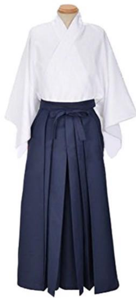
Aikido 4a đai đen