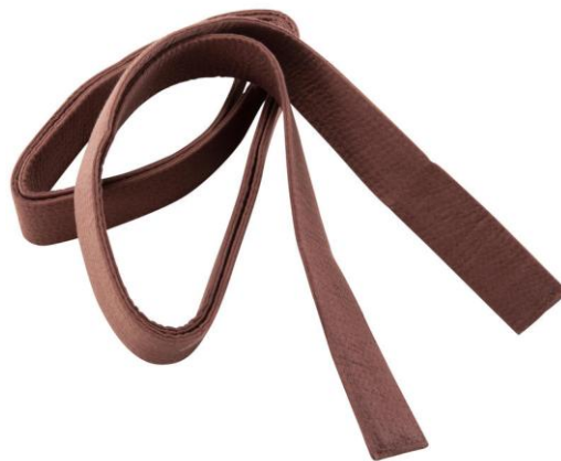
Aikido 3 đai nâu