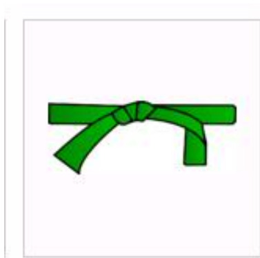
Đai xanh lá