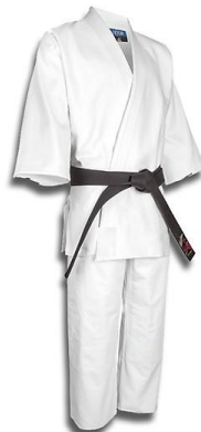
Aikido 4 đai đen