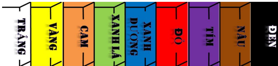
Màu của đai Karate từ thấp lên cao