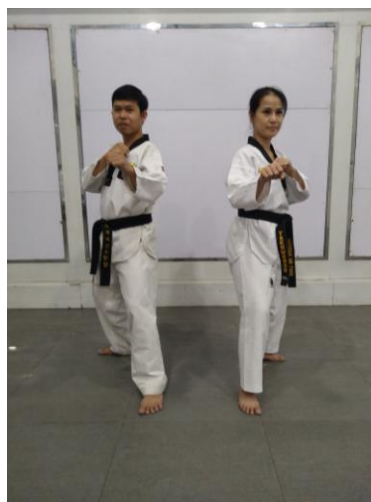
Đai đen của võ sư trên nền võ phục màu trắng môn Teakwondo