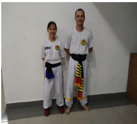
Võ phục màu trắng của võ cổ truyền môn phái Sa Long Cương