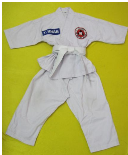
Aikido 1 đai trắng