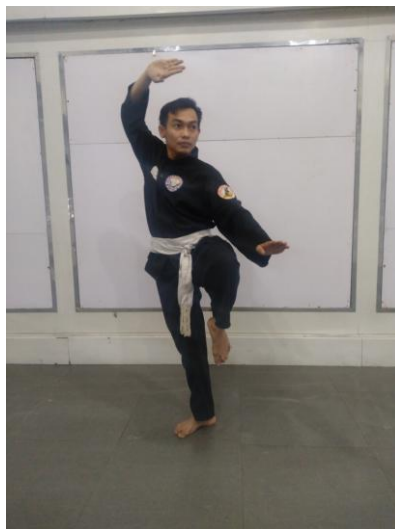
Đai trắng của võ sư trên nền võ phục màu đen (màu đai cũ)