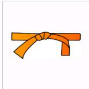
Đai da cam