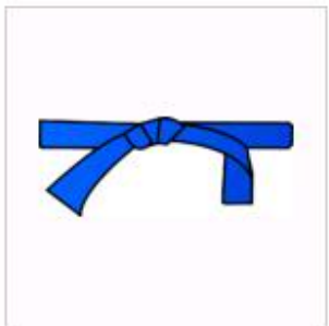
Đai xanh dương