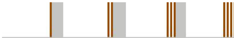
Màu đai bậc 1 của võ cổ truyền Việt Nam