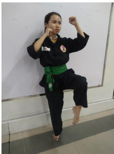
Đai xanh trên nền võ phục cổ truyền màu đen